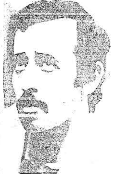
TEHERAN, 7 (AP) - Mhamed Jawad Baguri Tonguyan, Ministro de Petróleo de Irán, fue capturado la semana pasada por fuerzas iraquíes y sufrió una hemorragia masiva por las graves heridas recibidas en el frente de batalla de Abadan. Los doctores iraquíes luchan por salvarle la vida. Irán dice que fue torturado y que por eso está al borde de la muerte. (LASERFOTO).

La producción de este año, afirman los funcionarios, representó una salvación para Ver: Trasnacionales, Pág. 12, Col. 1