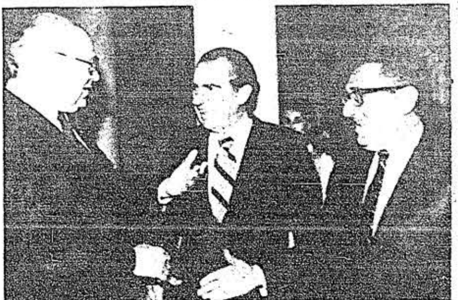
WASHINGTON, 7 (AP) - El embajador soviético en Washington, Anatoly Dobrinin (I), salida al ex Presidente Richard Nixon y a Henry Kissinger (D) en una recepción

En el análisis de la Cuenta Pública, contenido en un resumen de divulgación que en breve comenzará a ser distribuido, la Secretaría de Programación y Presupuesto señala también que los organismos y empresas descentralizadas obtuvieron ingresos por 172 mil 839 millones, casi lo mismo que un año antes, a pesar de que se esperaba que percibieran 33.5 por ciento menos.